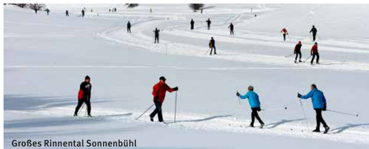
Großes Rinnental Sonnenbühl