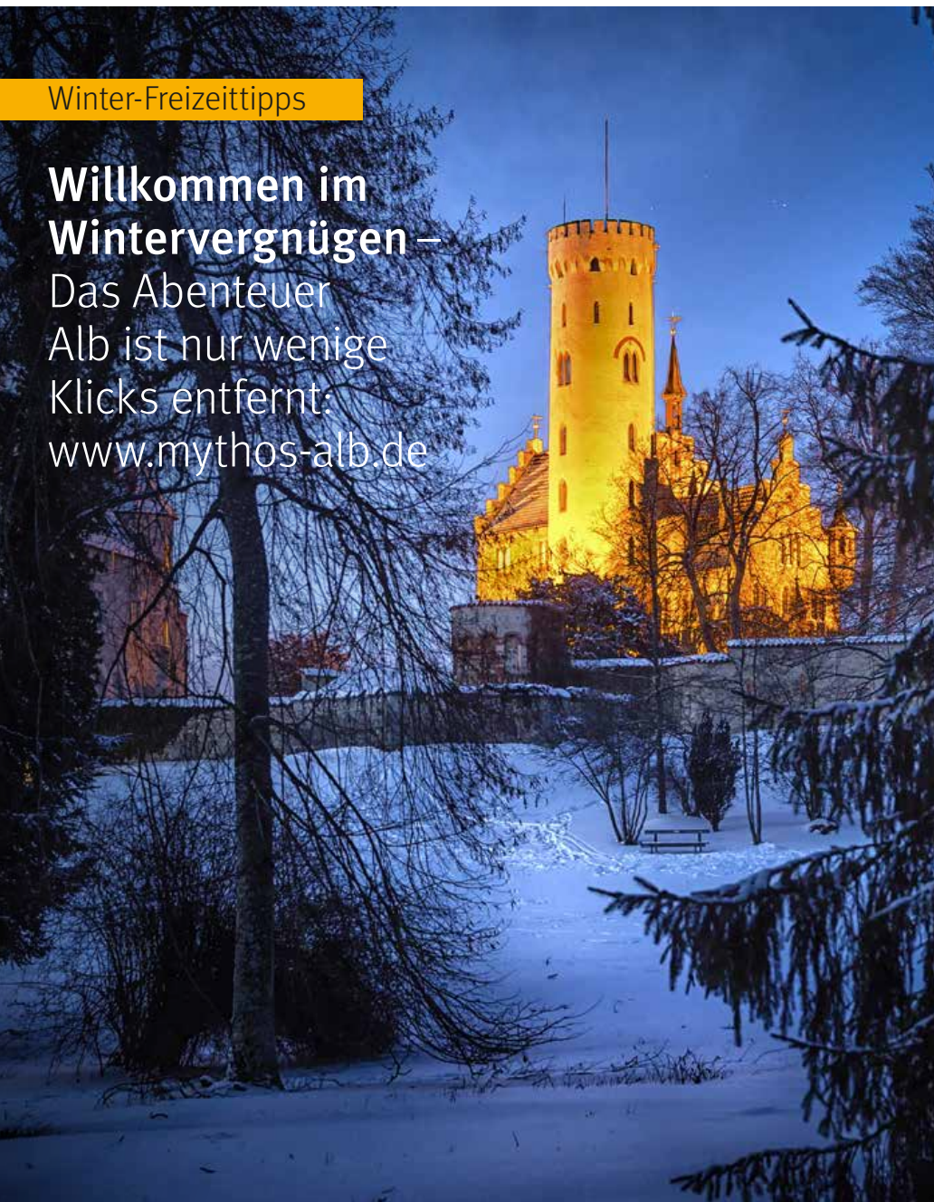
Titelbild: Schneeschuhwanderung bei Münsingen - Dottingen

Willkommen im Wintervergnügen – Das Abenteuer Alb ist nur wenige Klicks entfernt: www.mythos-alb.de