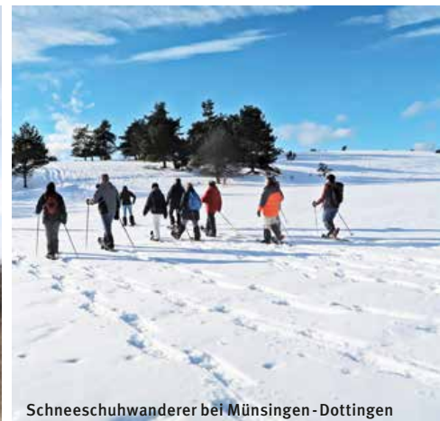
Schneeschuhwanderer bei Münsingen - Dottingen