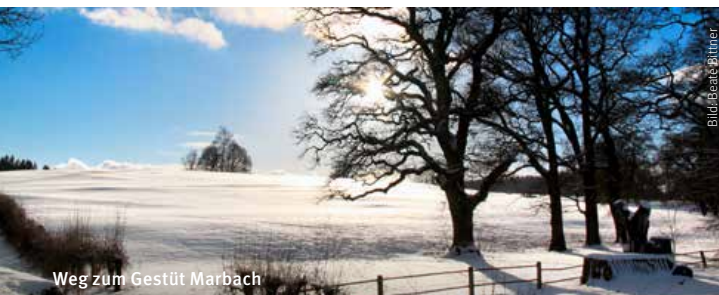
Weg zum Gestüt Marbach

Info: Haupt- und Landgestüt Marbach, Gestütshof 1, 72532 Gomadingen, Telefon 07385 9695-37, -o, www.gestuet-marbach.de